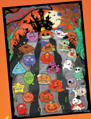
必Buy Spooky Halloween 情境遊戲海報