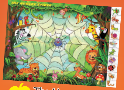
必Buy The Hungry Spider 情境遊戲海報