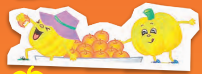
必Buy 迷你裝飾板~可愛南瓜園